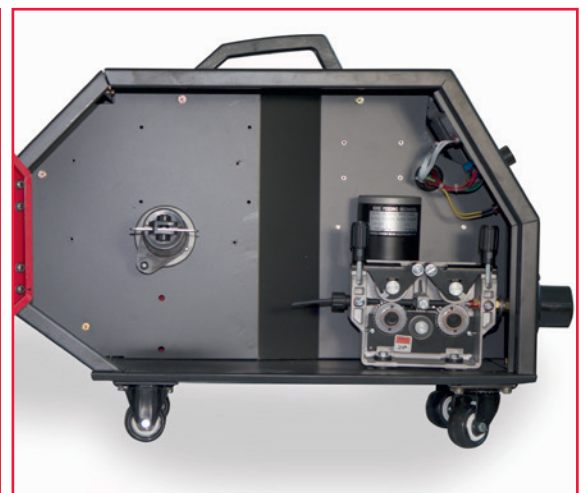
Drahtaufnahme für Spulen bis 15 kg